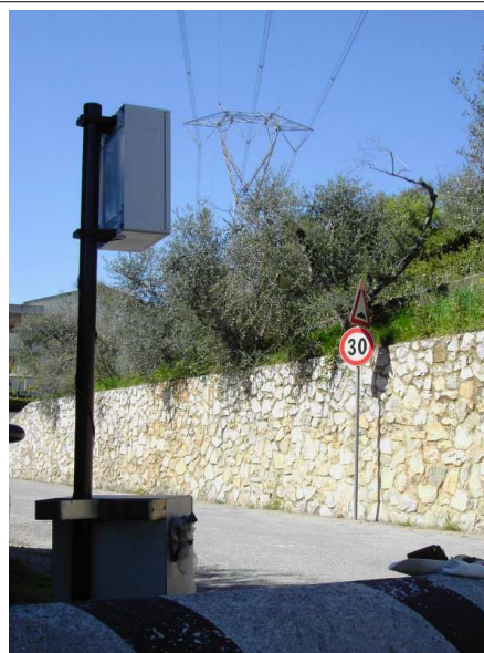
Località La Gabella, Calci (PI)