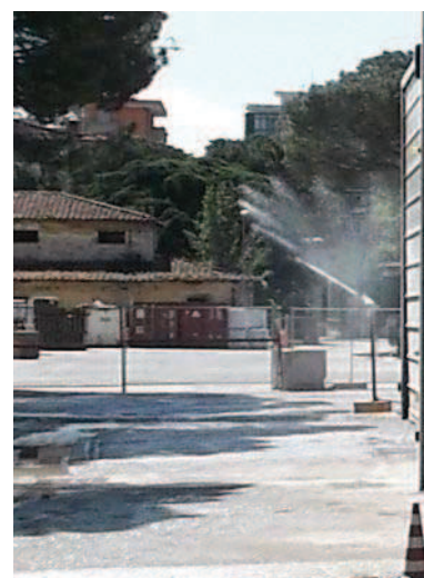
Bagnature dell'impianto di betonaggio. cantiere Stazione AV.

In merito ai dati di particolato (PM10), le differenze tra i dati misurati con i due metodi (gravimetrico ed automatico 2 ) sono risultate in diversi casi al di fuori dell'usuale range di accettabilità; ARPAT ha ritenuto accettabile solo il caso di sovrastima del metodo automatico rispetto al gravimetrico (in quanto il primo è il valore in base al quale viene valutato il superamento dei valori soglia).