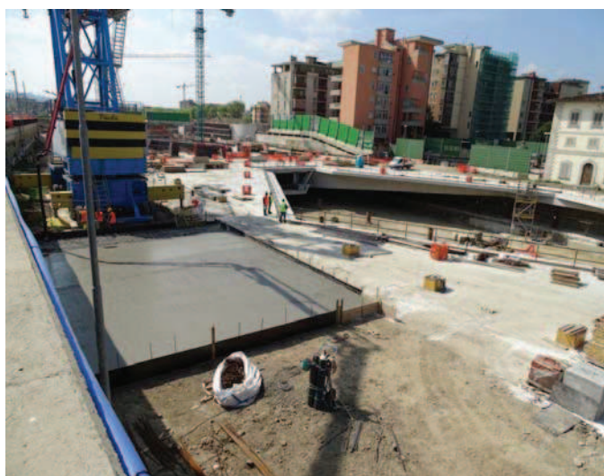
Cantiere Stazione AV - aprile 2017.

In merito alle attività di cantiere, nel primo semestre 2017 sono state effettuate lavorazioni quasi esclusivamente presso il cantiere Stazione AV (area ex Macelli - via Circondaria, Firenze), dove sono state quasi completate le strutture metalliche ed il getto del solaio del piano terra della nuova Stazione AV. Sono inoltre proseguiti i lavori di realizzazione della rampa cd. “kiss&ride” (posta fra il Torrente Mugnone e via Zeffirini) nonché realizzate ed attivate le tre ulteriori coppie di pozzi (aggiuntive alle 4 già presenti) per la mitigazione dell'impatto sulla falda.