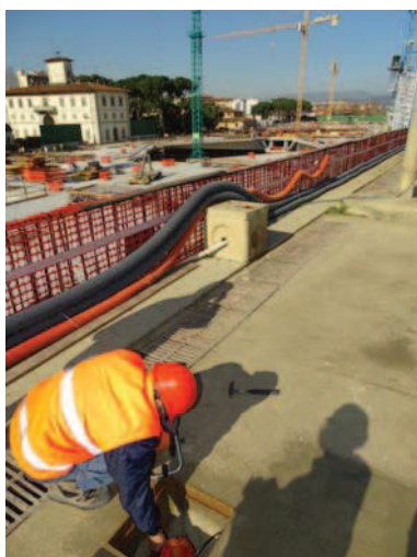
Misura su piezometro, cantiere Stazione AV.

Dalle misure effettuate da Italferr nel dicembre 2016 è emerso che il metodo di misura è conforme a quanto indicato nel Piano di Monitoraggio Ambientale; i livelli di pressione sonora misurati, riconducibili alle attività di cantiere, sono risultati contenuti entro i limiti di legge.