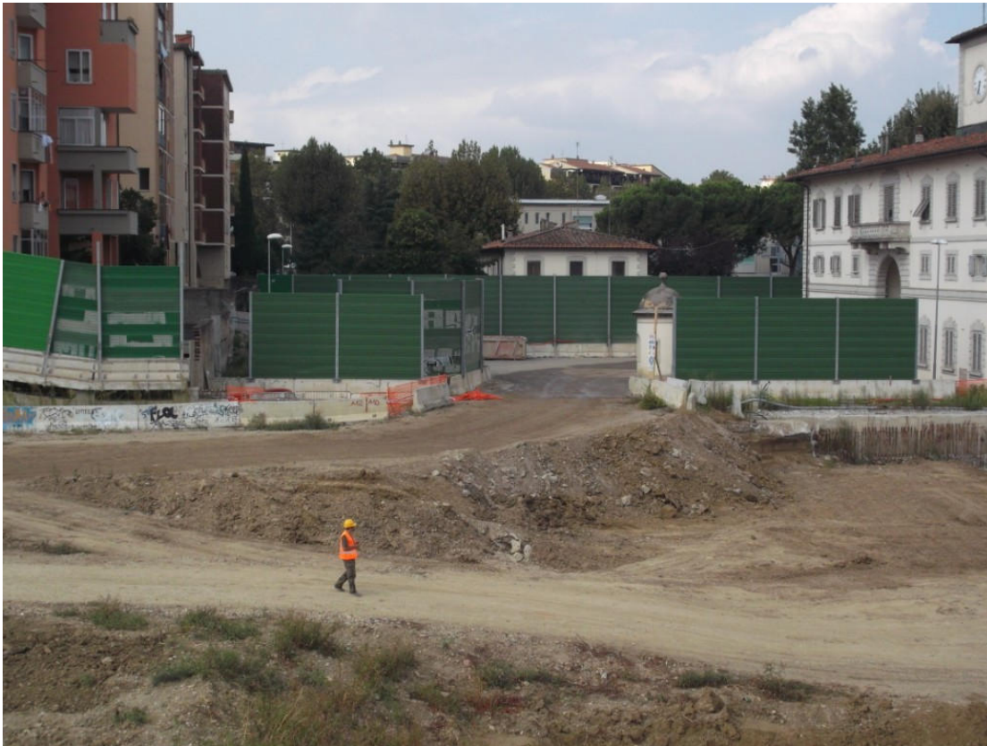
vecchio accesso fra l'edificio dell'orologio e via Zeffirini, che sarà chiuso