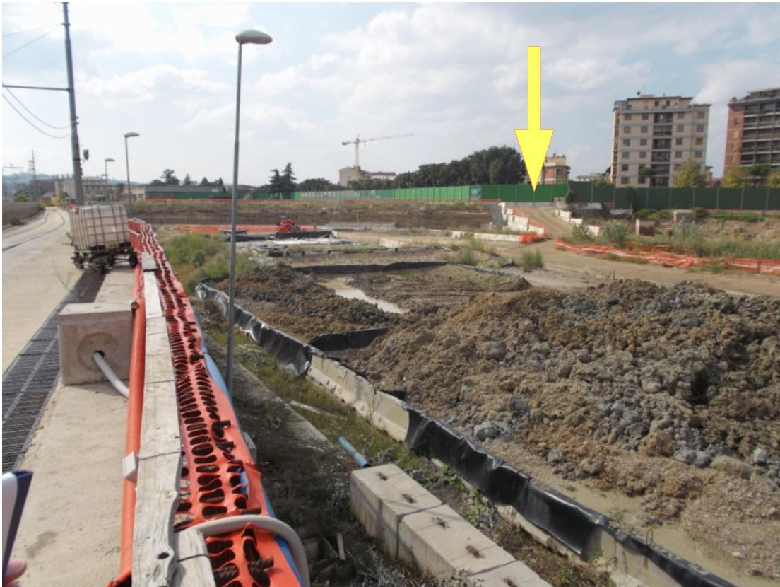
Nuova rampa (freccia gialla) lato sud camerone, di collegamento con il corridoio attrezzato (sulla sinistra)