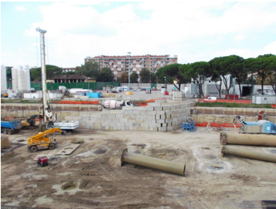
Nuova rampa di accesso lato nord camerone (di fronte all'impianto di betonaggio)