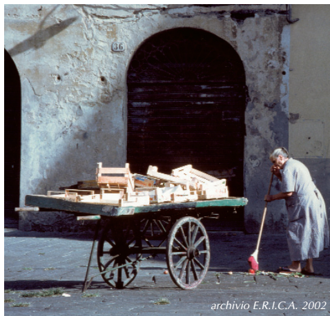
archivio E.R.I.C.A. 2002

Questi comportamenti diventano ancor più esemplari perché agiscono su un luogo di diffusione di cultura ed influenzano una collettività. Lo stesso accade nelle strutture ricettive o nei luoghi di frequentazione dove comportamenti virtuosi in tema di riduzione dei rifiuti assumono un ruolo di esempio per i numerosi fruitori. Per le strutture ricettive possono diventare un carattere distintivo che certifica le scelte ambientali e che dunque può assumere un valore di marketing per i turisti "sostenibili".