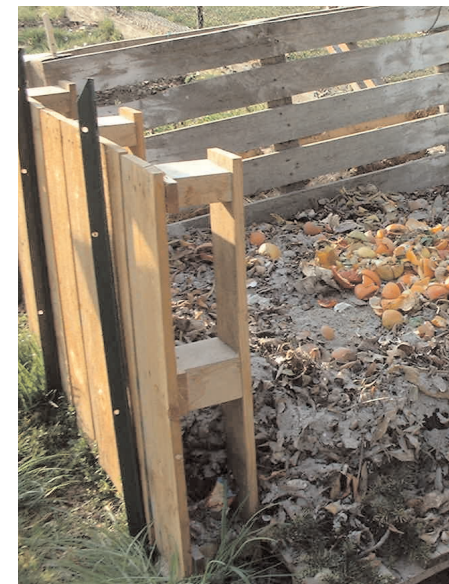
archivio E.R.I.C.A. 2006