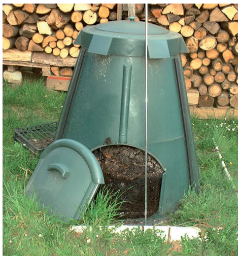
archivio E.R.I.C.A. 2005

D'altra parte molte città o regioni hanno già messo in campo azioni di prevenzione, mentre altre sono praticamente al punto zero.