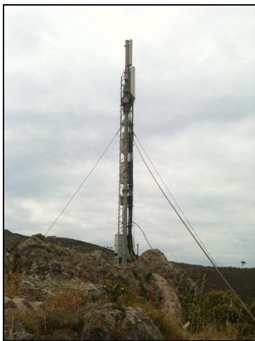
SSRB in co-site WIND e H3G